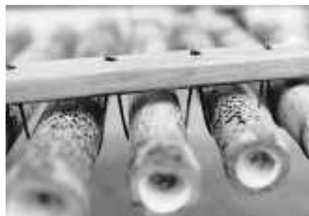
Aufhängung unterhalb der Grundleiste