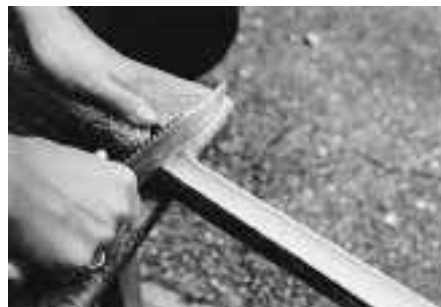
Zunge tiefer stimmen