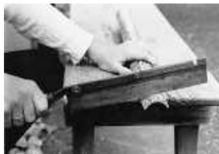
Zunge höher stimmen

Die tiefe Töne sind einfacher einzustimmen.