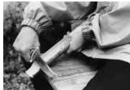
Zunge höher stimmen