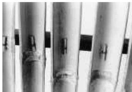
Aufhängung unterhalb der Stirnleiste (gespannt)